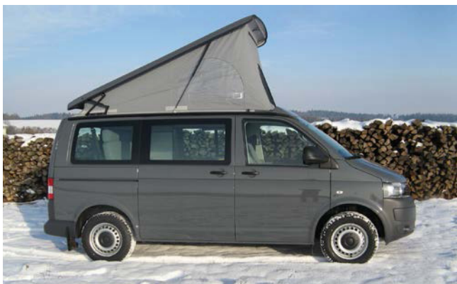
Ein Offroad Campingbus mit viel Stauraum und herausnehmbarem Gaskocher