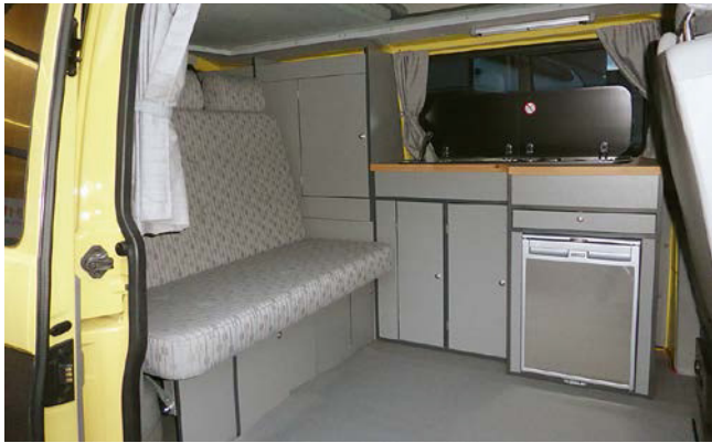
Der Multi 1 ist auf Wunsch mit Premium Möbelzeile erhältlich