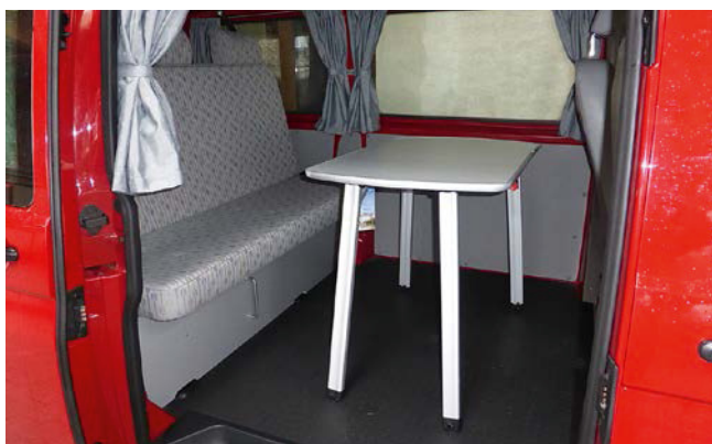
Der Flexi von Summernobil für den Alltag und den schnell entschlossenen Camper.